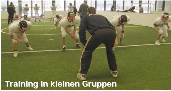
Training in kleinen Gruppen