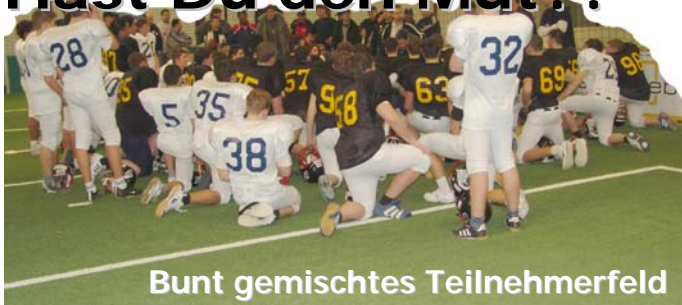
Bunt gemischtes Teilnehmerfeld